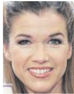
Anke Engelke hatte Comedy-Komplexe.

Die Komikerin Anke Engelke offenbart in einem Interview mit dem „Stern“ ihre ernste Seite. „Ich hatte lange Zeit Komplexe“, erzählt sie. „Ich hatte das Gefühl, mir fehlt etwas, der Besuch einer Schauspielschule oder eine vergleichbare fundierte Ausbildung“, so Engelke. „Ich hatte so einen Rechtfertigungs-