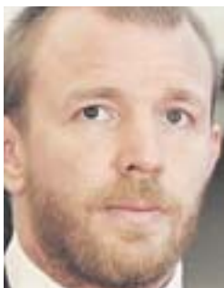
Guy Ritchie ärgert Madonna mit Chlorwasser.

hat seiner Noch-Ehefrau Madonna (50) bei der Füllung des Pools in ihrem Anwesen einen gehörigen Strich durch die