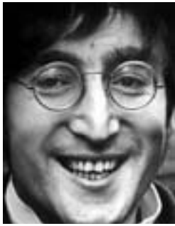
Hatte John Lennon ein Geheimnis.

Eine Behauptung von Beatles-Biograf Philip Norman sorgt in England für Aufregung: In „John Lennon - The Life“ behauptet der Autor, der Sänger habe sich eine Beziehung mit seinem Bandkollegen Paul McCartney gewünscht. Eine Affäre zwi-